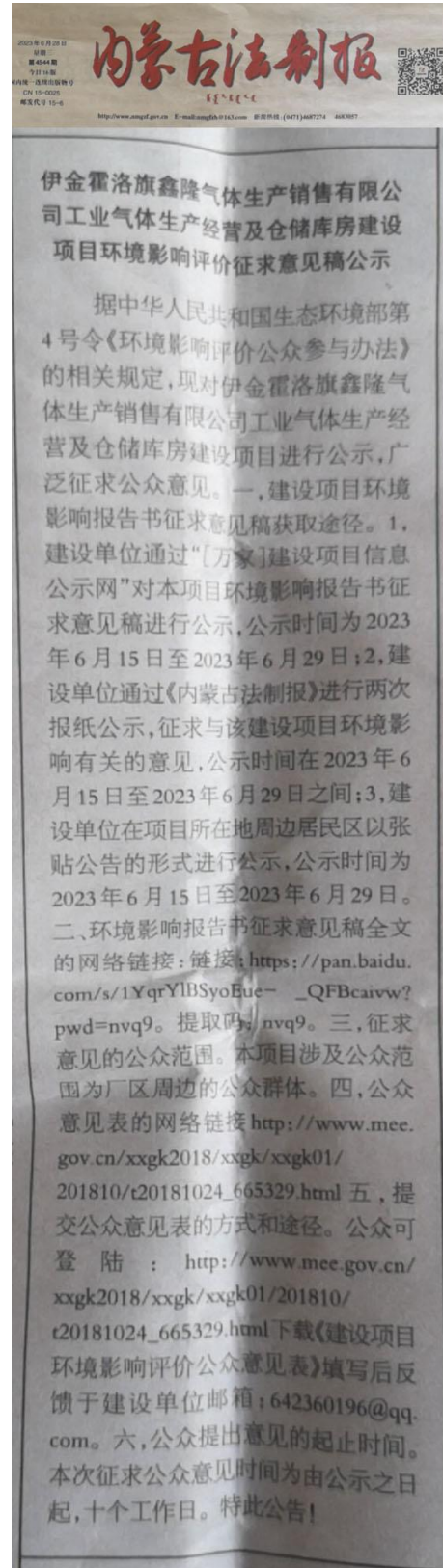
图 3-4 报纸公示