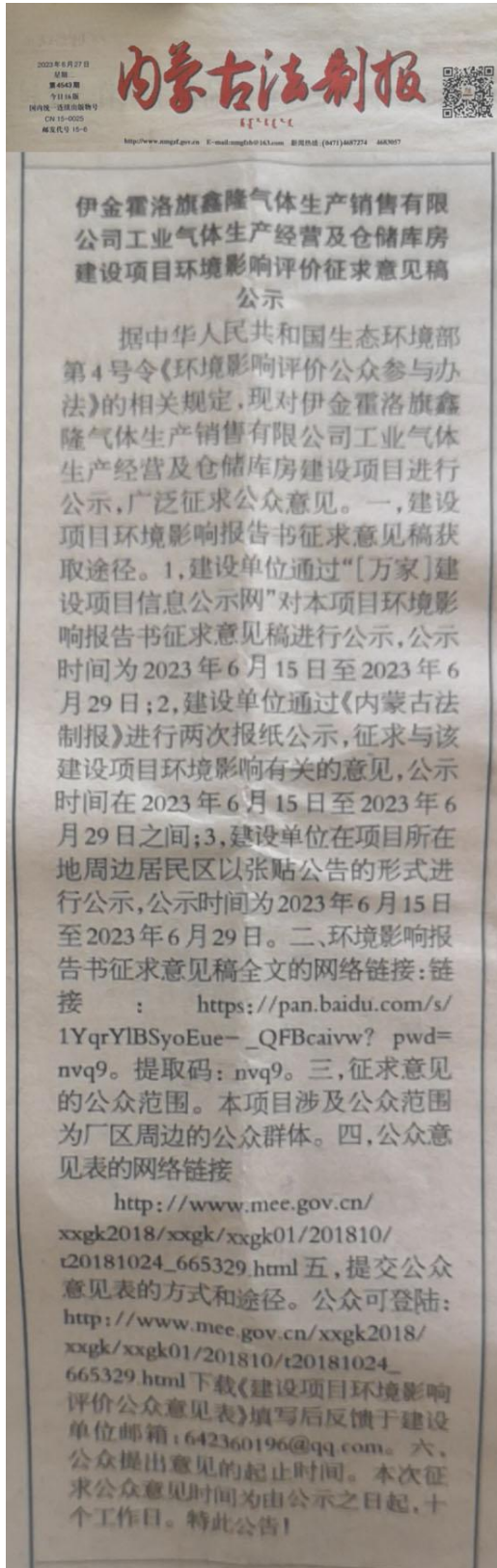
图 3-3 报纸公示