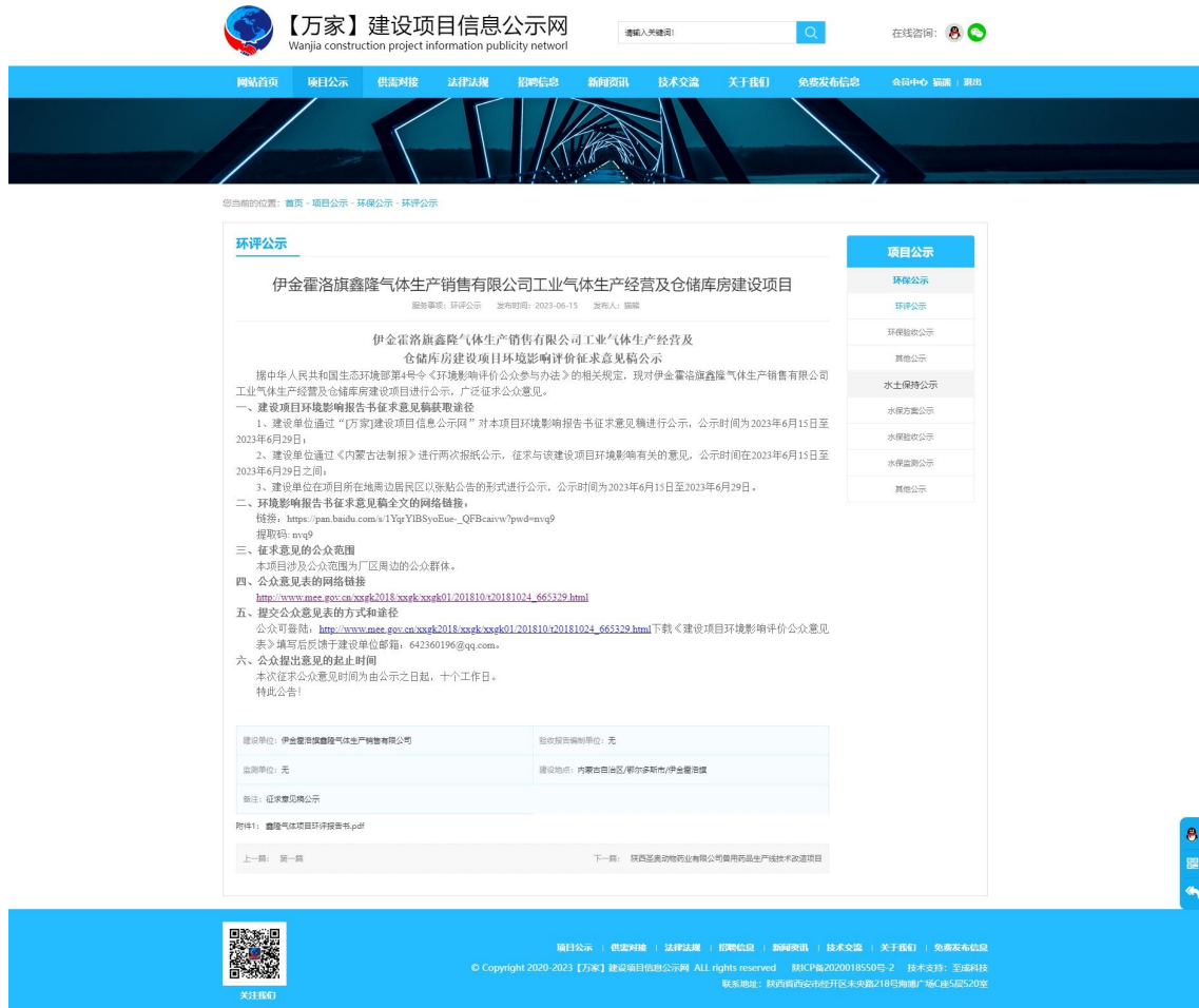
图 3-1 征求意见稿网络公示截图