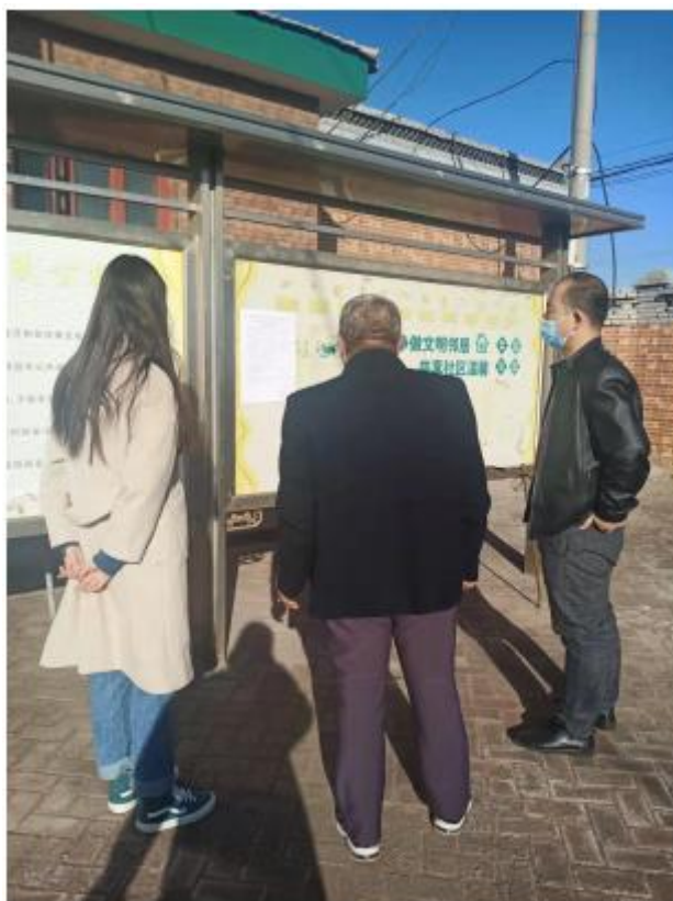
图 3-5 征求意见稿公示张贴的照片

本项目环境影响报告书征求意见稿的张贴公示选取项目评价范围内的园区管委会及项目周边进行张贴，张贴时间为2023年6月15日至6月29日。张贴区域位于项目的评价范围内，选取符合《环境影响评价公众参与办法》的要求。公示张贴的照片详见图3-5。