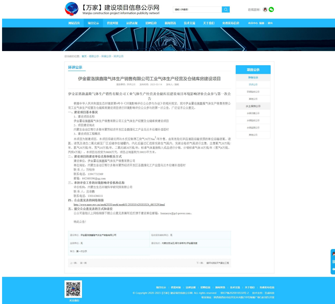
图 2-1 第一次公示截图